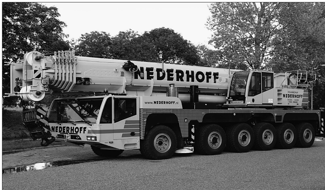
Heftabel hoofdgiek 75% van de kieplast 360° draaibaar

Gewichten hijsblokken 10 ton balgewicht 350 kg. 67.3 ton 3-schijs 850 kg.